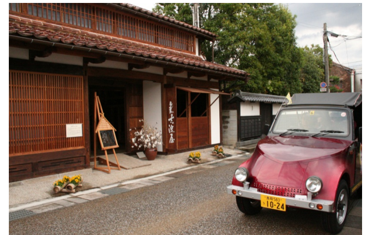
市に現存する最古の町屋建物