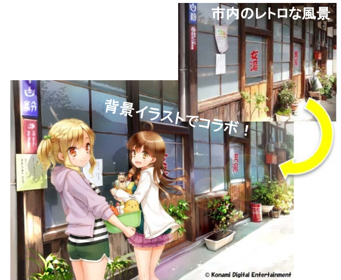
キャラクターを市内のレトロな風景と融合させた企画