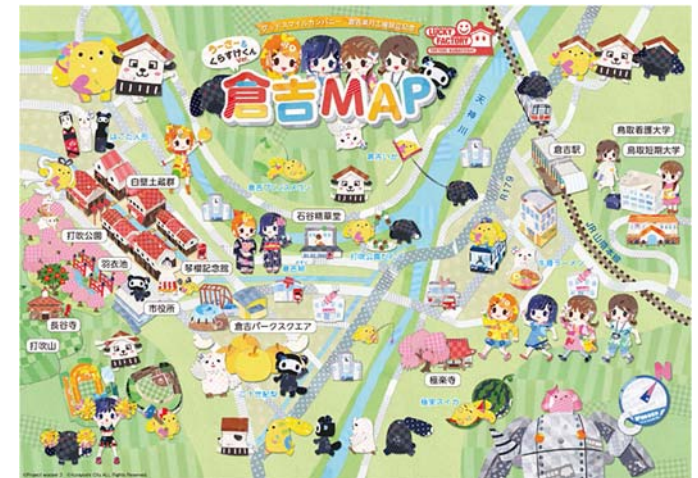
キャラクターとコラボした聖地巡礼マップ