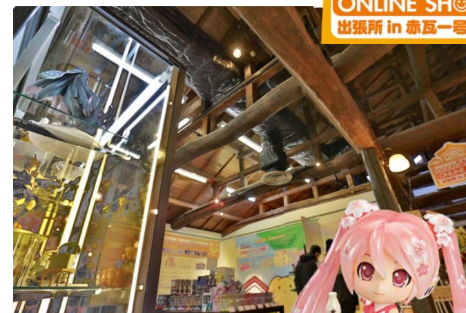
白壁土蔵群にある醤油蔵を リノベーションしたレトロなギャラリーで 開催されるフィギュアなどの展示会

©Crypton Future Media,INC. www.plapro.net piapro