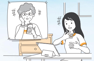
●家族や友人との会話