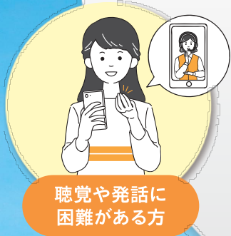
聴覚や発話に 困難がある方