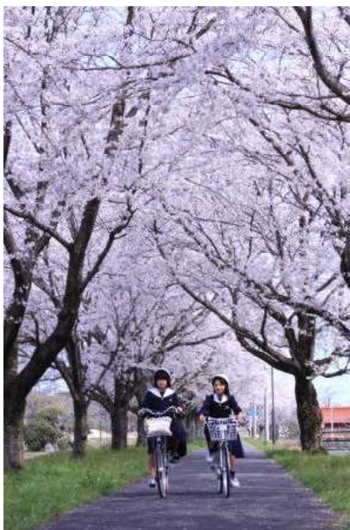
自転車通学の様子(中学生):ふれあいロード桜並木(上小鴨)

あわせて、総合教育会議では毎年度、倉吉市教育行政の点検及び評価について議論し、その進捗を図ることとします。