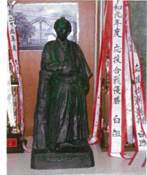
坂本龍馬像（校長室）