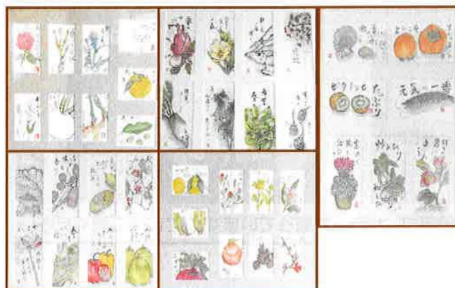
ちょこっとギャラリー 4月展示 絵手紙サークルさんの作品

国の緊急事態宣言を受けまして、公民館の貸館が5月6日(水)まで中止となっております。中止期間が延長の場合がございますので、詳細は公民館または代表者の方までお問合せください。