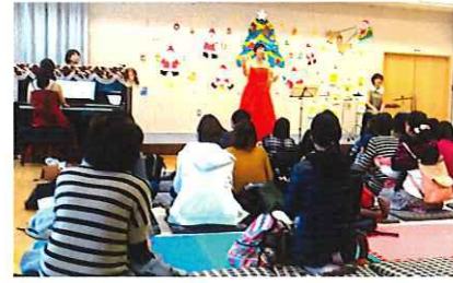
「メアリーズ」のコンサートを聴く(写真=上)。サンタさんからプレゼント(写真=左)