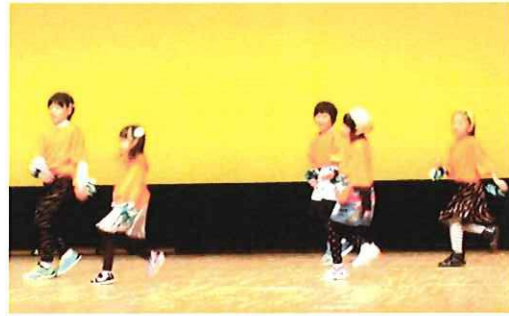
軽やかに、キレイなダンスするメンバー。(写真は映像処理しています)

12月8日(日)に行われた「倉吉市公民館まつり」の芸能発表会で、「あげあげ KIDS ダンスサーズ」は、リズム感あふれるダンスで