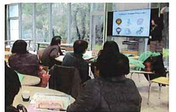
▲盛り上がった心理テスト

たことと現在はどうだったかを当時の写真で振り返り、心理テスト「山の頂上までどの動物を最後まで連れて行く?」では大いに盛り上がりました。月日が経つのは早いものですが、皆さんが3年間の受講を修了され嬉しい限りです。今後も健康づくり、仲間づくり、社会参加で公民館事業に参加したいと声がありました。