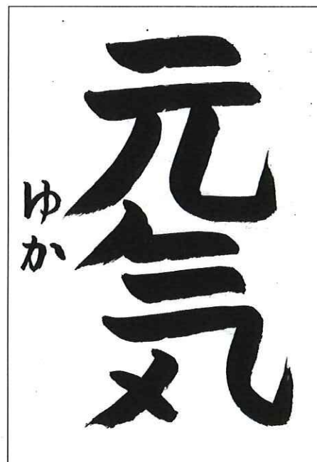
子ども書道教室の書き初め