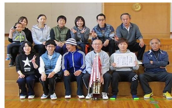
優勝した松河原公民館の皆さん