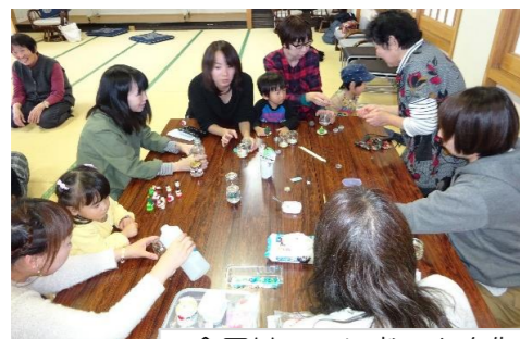
今回は、スノードームを作りました。

12月は、みんなでクリスマス会に自由参加です。 参加希望の方は小鴨公民館までお問い合わせください。