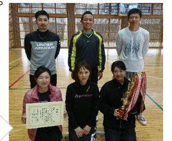
優勝の生田Aチーム