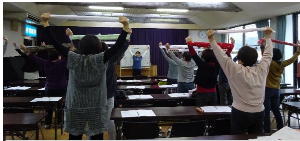
タオルを使った自力整体の様子です。 このあと、顔ヨガもしました。素敵な笑顔が増えました♡