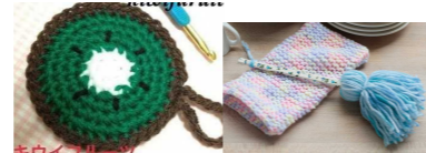
アクリルたわし と アクリル毛糸モップ