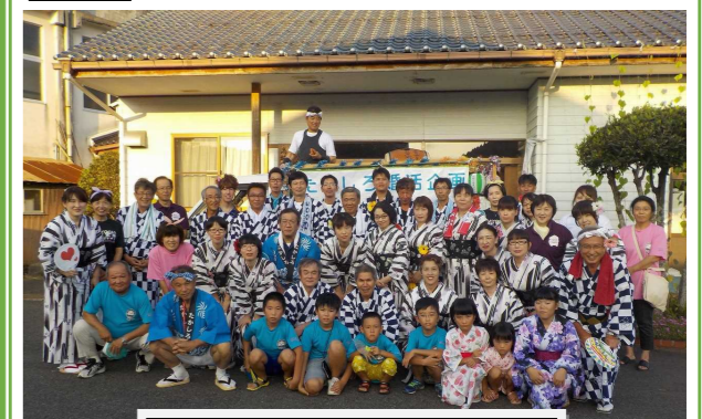
昨年の出発前の集合写真