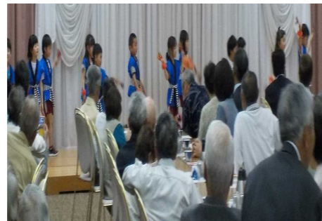
高城保育園児のかわいい踊りに笑顔が出ます！