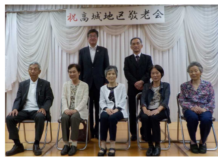
今年敬老会に新加入された方々です。(前列5名)

なお、本年度の参加者は85名（男性32名、女性53名）でした。ありがとうございました。それでは、当日の様子を写真で紹介します。