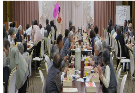
第二部の艶やかな演芸に魅了されます。