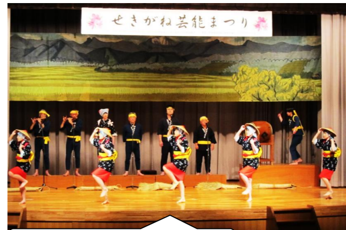
関金田植唄おどい伝承保存会

3月4日(日)、湯命館隣の関金都市交流センターにて「第13回せきがね芸能まつり」を開催しました。