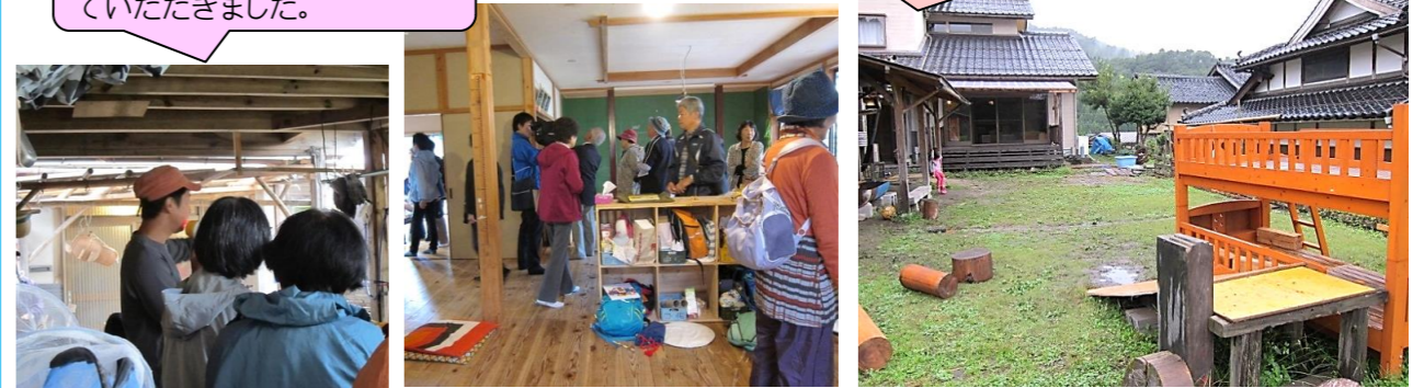
関金のすてきなところ また次号で紹介します♪