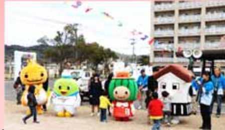
H29年『うわなだ桜まつり』より