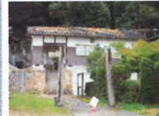
無残。神社の鳥居・屋根

残念・無念・・・第23回サラバンダin西郷'16 中止！ お世話になりました。来年もよろしくお願ひします。