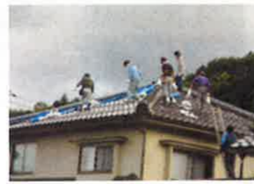
地元のボランティア隊、大活躍

★地元住民ボランティア隊・・・チームワークよろしく・・・大活躍・・・次々、作業完了！！