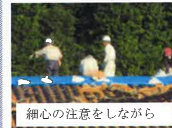
細心の注意をしながら