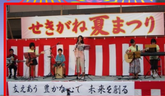
←関金公民館軽音楽部(せきおん)“サン シャイン”のステージ☆

8月15日(月)せきがね夏まつりを開催し、大勢の来場者で賑わいました。芸能ステージでは鴨川中学校吹奏楽部をはじめ、華やかなステージを披露していただきました！子どもたちの力強い太鼓と歌声にあわせて踊ったみつばし盆踊り☆ご指導いただいた方々、ありがとうございました。 今年も地域の皆さまや多くの企業さまに、ご寄附並びに抽選会賞品をご提供いただき「せきがね夏まつり」を盛会に開催することが出来ました。ありがとうございました！ (せきがね夏まつり実行委員会)