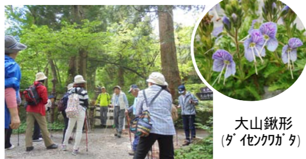
大山鍬形 (ダ'イノカタ)

樹木、草花、歴史など夏山登山道「僧兵コース」を歩きながら、自然歴史館館長さんの楽しく分かりやすい解説で大山を学びました。実際に見て、体感して、という学習は年齢に関係なく大切な事ですね。