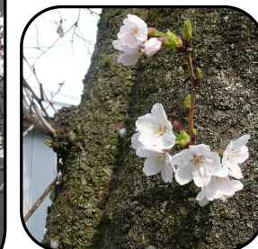
公民館のサクラ:平成28年の開花は3月23日