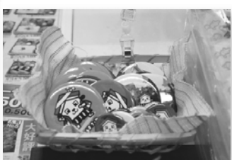
■市役所の売店でくらすけくん缶バッジを発見! いつの間にか…!?

倉吉市のイメージキャラクターに選ばれてから、市役所ではボクをみんなに知ってもらうために、パンフレットや封筒などの印刷物にボクのデザインを使ったりしているから、色んなところで見てもらえよ。