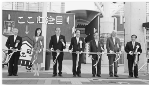
■「倉吉駅橋上化事業・上井羽合線沿道土地区画整理事業竣工式」(6月1日(金))でのテープカットの後ろにもくらすけくんがいたっ!

生まれて初めてカメラに乗せていただきました。取材に出る前上司から「カメラはめらすなよ」と言われました。戻ったときには、真つ先に「カメラは大丈夫だったか」と聞かれました。そうですか、心配するのはそこです。か。ええ、大丈夫でしたよ。カメラも私も。大山池の真ん中は、波模様がとても美しく、水音が心地よい、自然と癒やしの空間でした。その分、カメラを漕ぐ子どもたちの懸命な息遣いが耳に残っています。全国大会まであと1ヵ月。頑張れ! 私山梨まで取材で行きたいな〜(Y・T)