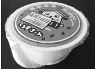
■学校給食の「じげの味探検日」(6月19日(火))には、デザートシールに登場!

倉吉市のイメージキャラクターに選ばれてから、市役所ではボクをみんなに知ってもらうために、パンフレットや封筒などの印刷物にボクのデザインを使ったりしているから、色んなところで見てもらえよ。