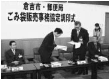
郵便局との調印式

これに伴い、関金町で既に郵便局でごみ袋を取り扱っていた経過から、市内の郵便局でも取り扱っていただくよう、2月25日(金)に、調印式を行いました。