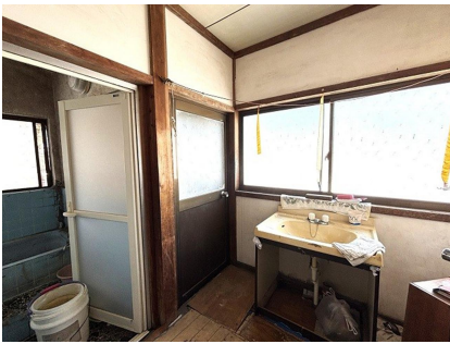
脱衣所&洗濯機置き場