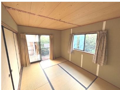
和室 6 帖