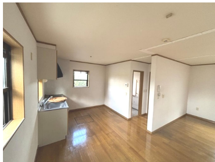
ダイニング・キッチン