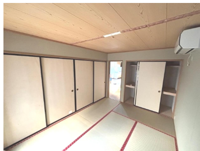
和室 6 帖