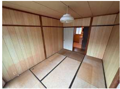
和室 6 帖