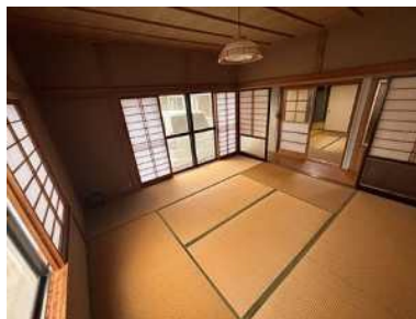
和室 8 帖