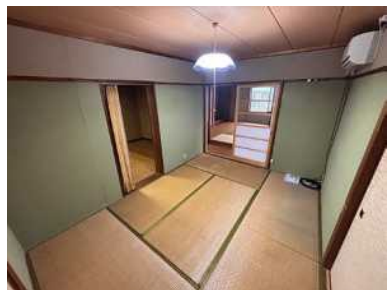
和室 6 帖