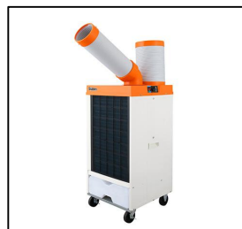
スポットクーラー