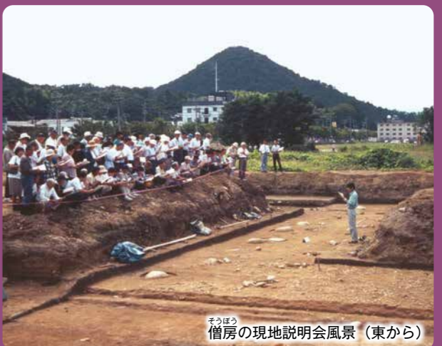
僧房の現地説明会風景（東から）

僧房は東西に細長い建物で、中央に南北通路が設けられています。通路の両側に各3部屋、計6部屋があり、1部屋は約40畳の大きさで、少なくとも6人程度の僧が居住できたと考えられます。僧房の大きさや間取りが明らかになることは極めて珍しい発見です。