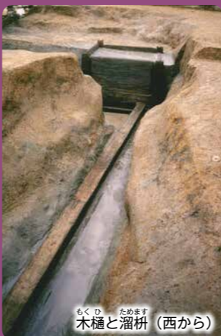
木樋と溜枮（西から）

寺院西方の水源から、全長96mの木樋を流れてきた水を、1m四方の溜枮に貯めていました。ここで仏前に供える水や生活用水をくんでいたと考えられます。このような木樋と溜枮からなる上水道施設は、奈良時代には他に例がなく、非常に珍しいものです。