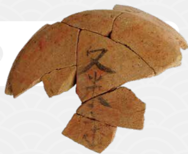
「久米寺」と書かれた土器

出土した土器に書かれた文字「久米寺」から寺院名がわかり、伯耆国の役所（伯耆国庁）が置かれた久米郡の中心的な古代寺院といえます。奈良時代（8世紀前半）には下の復元イメージ図のように建物が整備され、平安時代（10世紀ごろ）まで存続したと推定されています。