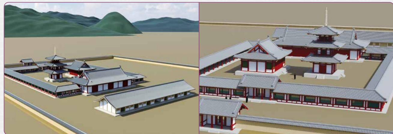
復元イメージ図 CG作成：米子工業高等専門学校 M.TOGO