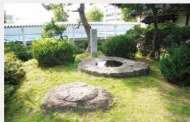
塔の心柱を支える礎石（奥）と四天柱を支える礎石（手前）