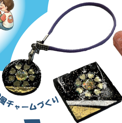
時絵園チャームづくり