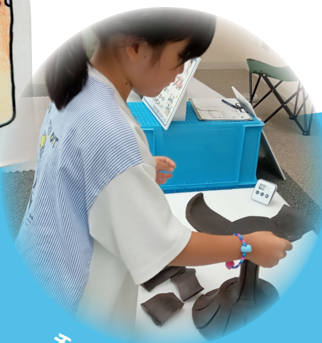
チャレンジ!土器パズル