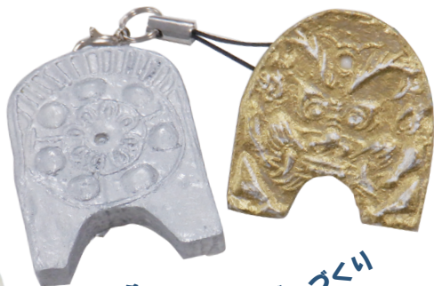
鬼瓦キーホルダーづくり