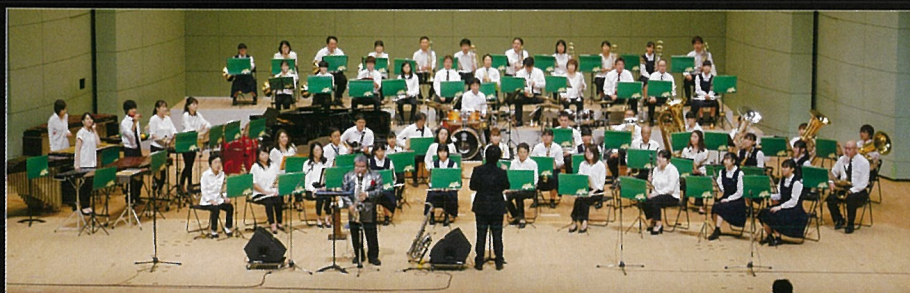
倉吉天女音楽祭吹奏楽団

1983年デビュー作「MALTA」リリース。1988年「HIGH PRESSURE」大ヒット。2010年から毎年、自身のアトラム・レーベルから、CDをリリース。2011年「MALTA JAZZ BIG BAND」を結成。「MALTA Hit&Run」、「MALTA & イープンオーケストラ」、「MALTA 七人のサムライジャズバンド」など編成の異なるバンドでも全国各地でコンサートを精力的に行っている。現在は、倉吉市観光大使など、地元の活性化にも尽力されている。