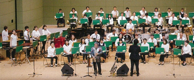
倉吉天女音楽祭吹奏楽団

13:55 打吹童子ばやし・和太鼓LEGEN童 14:15 関金子供歌舞伎 14:35 休憩 ※来場者の入替はありません 14:45 第19回倉吉天女音楽祭 中部少年少女合唱団MIRAI MALTA Solo Stage MALTA&倉吉天女音楽祭吹奏楽団 15:45 閉会予定