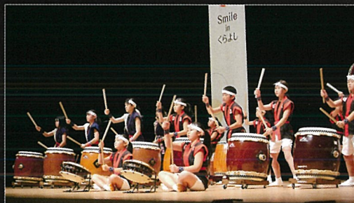
打吹童子ばやし・和太鼓 LEGEN 童