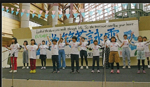
中部少年少女合唱団 MIRAI

県中部を中心に活動する打吹音楽倶楽部ブレイメン、中部ハートフルサウンド吹奏楽団のメンバーを中核に結成した吹奏楽団です。普段はそれぞれの場面で音楽に関わっている仲間が、心をひとつに、音楽の力を世界に向けて発信します。「MALTA&倉吉天女音楽祭吹奏楽団」の華やかなサウンドをどうぞお聴きください。