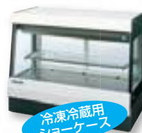
冷凍冷蔵用 ショーケース