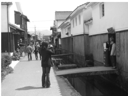
<赤瓦周辺の観光客>