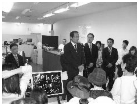
<「クラカフェ」オープンの様子> (平成22年10月)