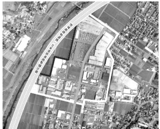
主要メイン道路 西倉吉工業団地 分譲予定地