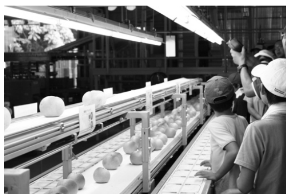
< 梨選果場を見学する児童 >