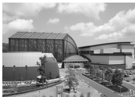
<倉吉パークスクエア>