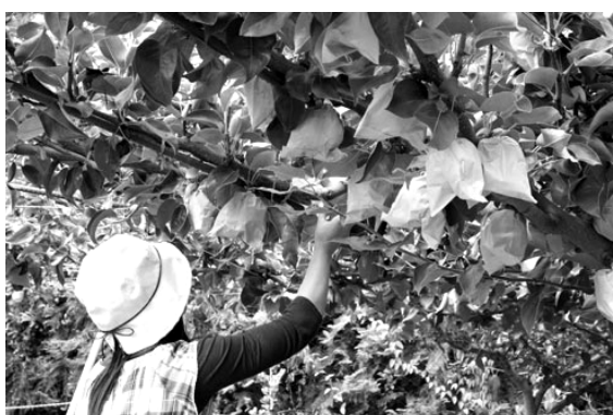
< 梨狩りの様子 >