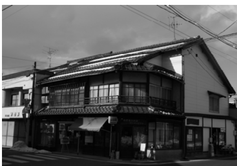
<チャレンジショップ>