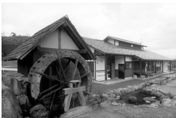
<水郷の郷体験工房>