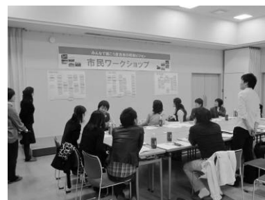
<本ビジョンの策定に際し、開催した市民ワークショップ> (平成 22 年 11・12 月開催)

市民が地域の公共的課題を解決するために、自治公民館などの地域自治組織、市民活動団体、議会、行政の活動に参画し、事業者も含め、各主体が目的を共有し、互いの特性や違いを認め、それを尊重しつつ、互いの信頼関係に基づいた対等な立場で役割を分担しながら、相乗効果を発揮するような協力・連携を行うこと。