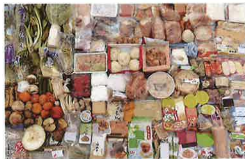
捨てられた手付かずの食品例

食べられるのに捨てられている食品ロスのこと。 日本では、年間600万トン以上の食品ロスが発生しています。 食品ロスの中には、手付かずの状態ですべて捨てられている食品もあり、この状況を多くの方に知っていただくことが大切です。