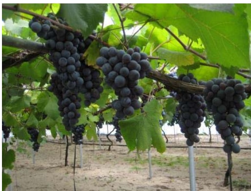
砂丘土壌と山陰の気候風土で育った ブドウ