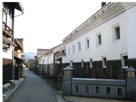
重要伝統的建造物群に選定された 白壁土蔵群