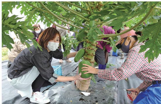
青パイヤの収穫作業の様子

倉吉農業高校では3年前から、青パイヤの栽培や活用研究に取り組まれています。ポリフェノール、ビタミンCなどの栄養素が豊富で、水やりや防除が不要で栽培が容易なことから、遊休農地解消対策としても有用な作物です。今後はニーズを高めることが課題で、消費者が手に取りやすくできるように調理レシピの取りまとめもされています。倉吉農業高校発で特産化が期待されます。