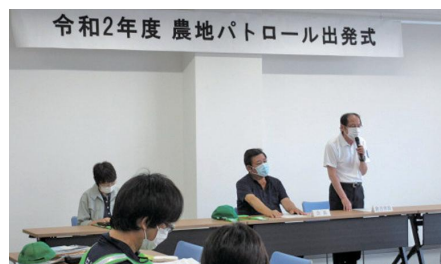
新体制での農地パトロール出発式の様子 R2.8.20

相続などで農地を取得しても、農業経験がないため耕作できない場合や、後継者がいないため農地を荒らしてしまう恐れがある場合には、農業委員会に相談してください。