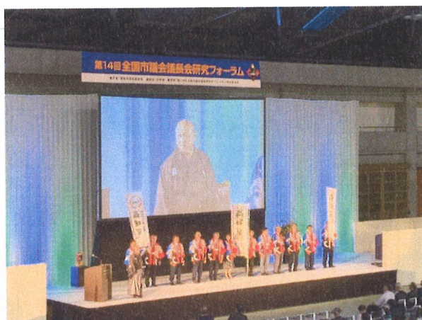
10/30 研究フォーラム（高知市）②