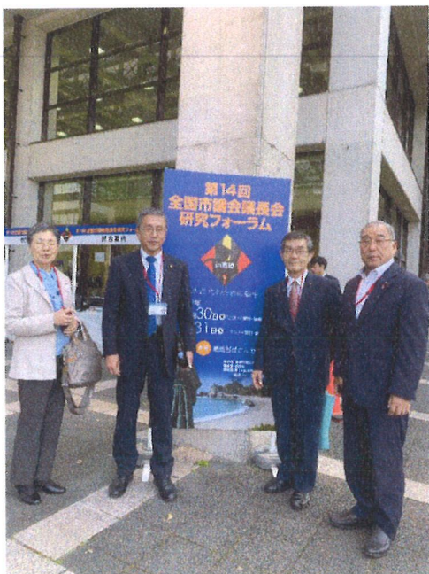
10/30 研究フォーラム（高知市）①