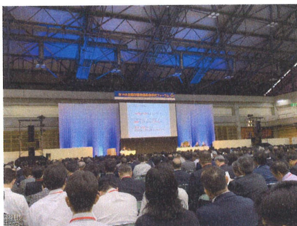
10/30 研究フォーラム（高知市）③