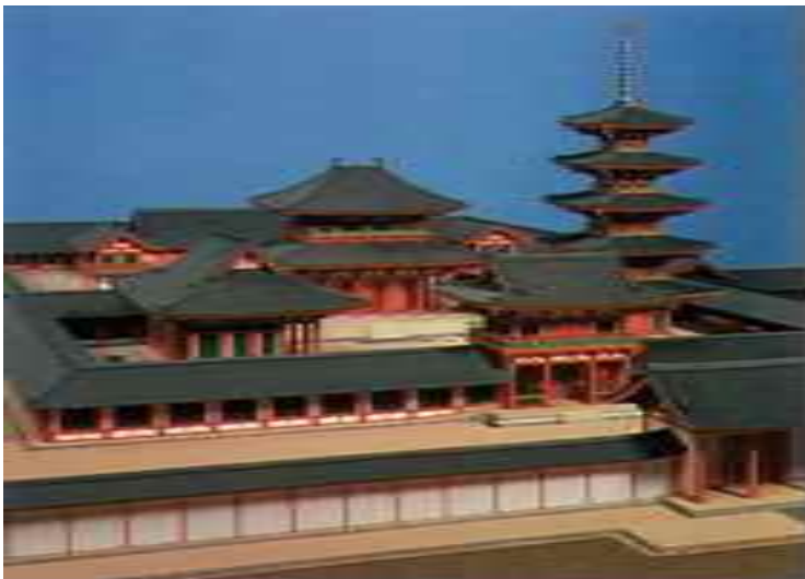
川原寺（奈良県・7世紀後半）復元模型