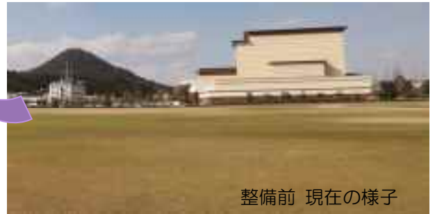
整備前 現在の様子