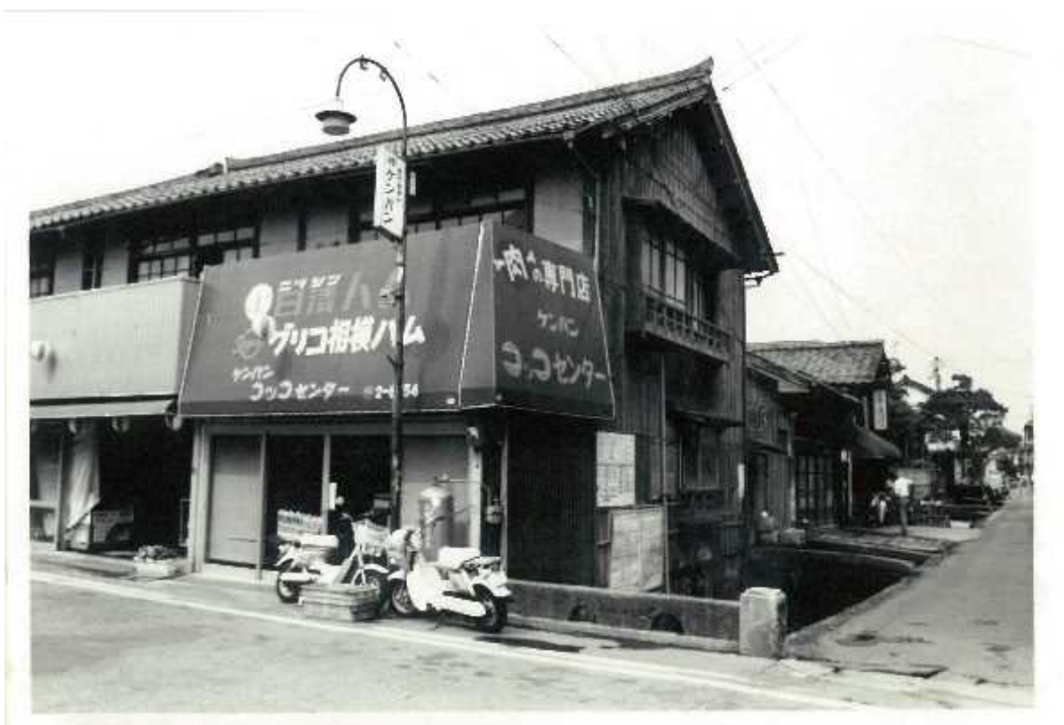
昭和 55 年：主屋HG18-2（北東より）

伝統的建造物群保存地区のほぼ中ほど、打吹公園通りと玉川沿いの町並みの景観を構成する歴史的建造物である。