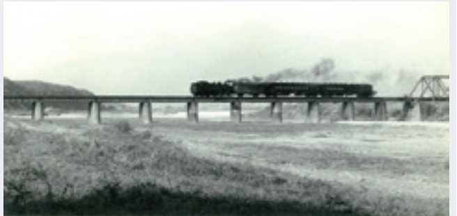
竹田川の鉄橋を渡る貨客混合列車(1972年)

1912年6月1日に開通し、1985年3月に廃線となった倉吉線の沿線や駅舎の写真、ホームの看板や昭和初期の駅スタンプなど関連資料を展示。あの日あのとときの思い出が胸によみがえります。