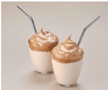
ダルゴナコーヒー

スフレのようなフワフワのオムレツのことです。材料は卵とバター、塩、砂糖です。卵は黄身と白身を分け、黄身に塩を入れてよく混ぜます。白身は泡立て器を使いメレンゲを作り、途中に砂糖を入れます。メレンゲに黄身を入れてよく混ぜます。フライパンにバターを入れて熱したら、弱い中火にして、黄身を混ぜたメレンゲを流し入れ、ふたをして火を通します。上まである程度火が通ったら、半分に折りたたみ皿に盛り付けて完成です。