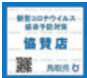
協賛店ステッカー

県では、事業継続のための鳥取県版新型コロナウイルス感染拡大予防対策例や業界のガイドラインを基に感染予防対策に自ら取り組むお店を募集しています。