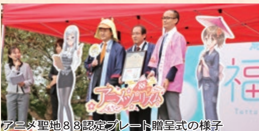
アニメ聖地88認定プレート贈呈式の様子

県立美術館の建設場所が倉吉市営ラグビー場に決定しました。県の県立美術館整備構想検討委員会で2年にわたって検討され、県立美術館候補地評価等専門委員会の評価、県民意識調査アンケートを経て、平成29年3月に鳥取県教育委員会にて選定され、基本構想として取りまとめられました。