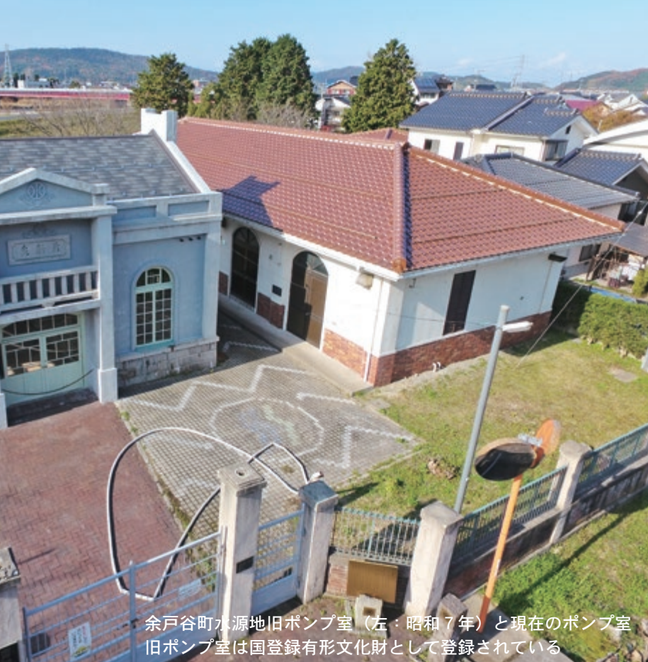
余戸谷町水源地旧ポンプ室（左：昭和7年）と現在のポンプ室 旧ポンプ室は国登録有形文化財として登録されている