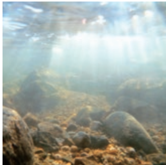
▲小鴨川水中(H29年10月撮影)

日本一きれいな小鴨川 市内を流れる小鴨川は、天神川水系で最も大きい支川で、中国地方最高峰「大山」を源とする清流です。 国土交通省によると、小鴨川は、中国地方一級河川で水質が最も良い河川とされています。 この評価には、ゴミの量、透視度、川底の感触、水のおいしさなどの項目も含まれることから、住民による清掃活動など、地域が一体となって水質保全活動に取り組んでいる結果ともいえます。 この美しい川が伏流水を生み、私たちの生活に欠かせない、そして倉吉の誇る「おいしい水」になります。 これからも「日本一きれいな川」をめざしたいですね。