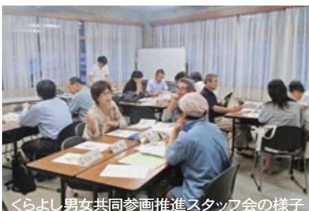
くらし男女共同参画推進スタッフ会の様子