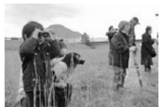
鳥さん見えるかな～？