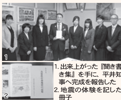
1. 出来上がった『聞き書き集』を手に、平井知事へ完成を報告した 2. 地震の体験を記した冊子

『聞き書き集 鳥取県中部地震の記憶』を地震発生から1年を迎えた10月21日に発行しました。鳥取県からの委託を受けて作成に取り組んだもので、鳥取看護大学の学生8人と鳥取看護大学・鳥取短期大学の教員3人が編集に携わりました。