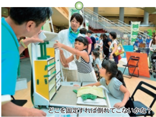
どこを固定すれば倒れてこないかな?