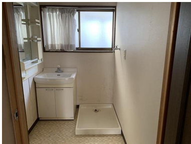
洗面所 & 洗濯機置き場