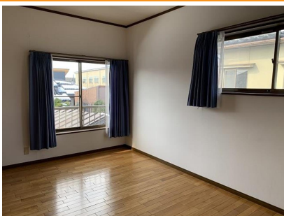
2階 洋室 7.5帖