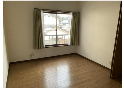
2階 洋室 6帖