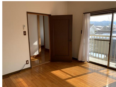
2階 洋室 8帖