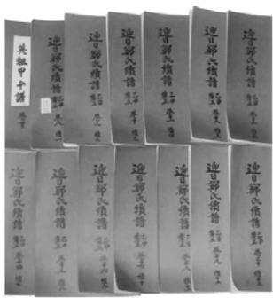
▶迎日鄭氏の家系を綴った族譜 (一族の系譜)