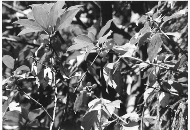
▲シロダモ(クスノキ科)の赤い実