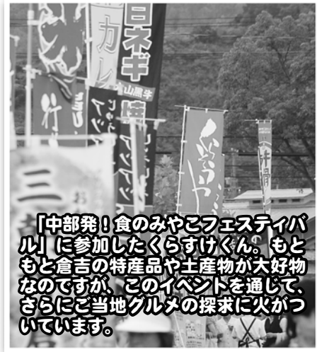
「中部発!食のみやこフェスティバル」に参加したくらすけくん。もともと倉吉の特産品や土産物が大好物なのですが、このイベントを通して、さらにご当地グルメの探求に火がついています。