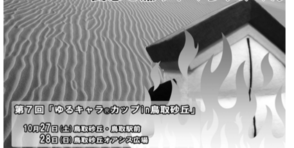
第7回「ゆるキャラカップ」鳥取砂丘