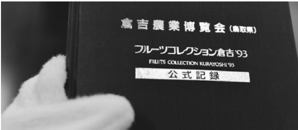
なになに…「フルーツコレクション」…? 何だかおいしそうなイベントだな〜。「倉吉市制40周年記念事業」って書いてあるよ。今から20年前か。どれどれ…