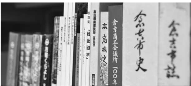
ボクの職場には、倉吉市などが発行した古い書籍がたくさん並んどるけ〜。