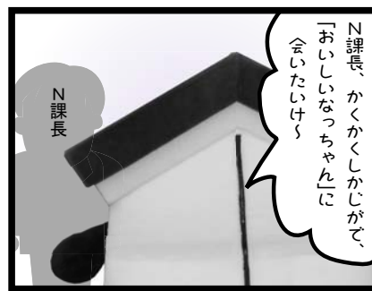
手がかりを求めてN課長に聞いてみた!

N課長「くらしのまげん、おいしいなっちゃんは、博覧会の終了とともに、昇天して姿を消してしまっただ。残念だけど、もう会えないんだよ…」