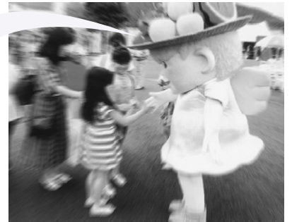
ボクと同じゆるキャラが大活躍じゃないですかー!!