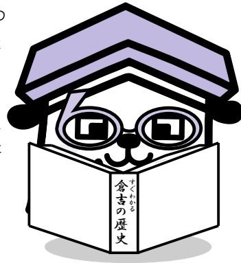
60周年はインターネットにエンジン!! メガネ注目!!