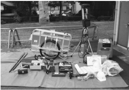
▲見日町自治公民館に整備された防災資機材

このたび、(財)自治総合センターが行うコミュニティ助成事業(地域防災組織育成助成事業)の助成金を活用して、見日町自治公民館が防災資機材を整備しました。 整備の内容 …トランシーバー、ヘルメット、メガホン、発電機、投光機、コードリール、インパクトドライバ、工具セット、チェンソー、金テコ、ボルトクリッパー、パイレンチ、リヤカー、救急箱、カケヤ、ディスクグラインダー等 今後、これらを活用し、自主防災組織の活動を推進するとともに、地域の防災力の向上を図っていきます。