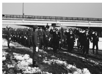
▲昨年の倉吉市消防出初式

年頭にあたり、本市の無火災を祈念し、消防団員(568人)の士気の高揚と、市民全体で「安心・安全のまち倉吉」の