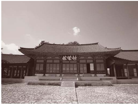
▶ 羅州の錦城館(クムソンガン)

●今月の一言● 「インプセギベ、マシッソヨ！」 「20세기배, 맛있어요！」 「20世紀梨, 美味しいよ！」