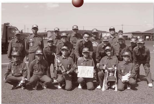
▲倉吉市消防団上井分団