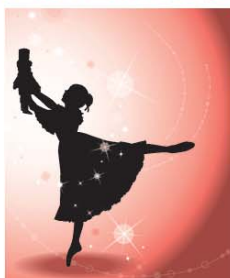
※入場券は配布中です。