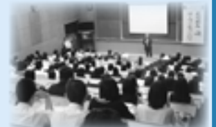
第1回オープンキャンパス 総合ガイダンスの様子