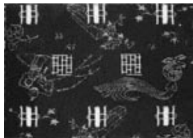
▲節句の柄を織り出した倉吉餅

「笹の葉さらさら 軒端に揺れる」、6日の夜、里芋の葉にたまった朝露で墨をすって短冊に願い事を書き、笹竹に結び付けます。現代では思いの願いを書くのが一般的ですが、古くは機織りや手芸、手習いの上達を祈願したといえます。倉吉餅が盛んであった明治・大正のころ、倉吉の女性たちも「機織りが上手になりますように」と、七夕の短冊に願いを込めていたのでしょうか。