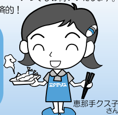
恵那手クス子さん

株式会社 エナテックス [信頼と技術と笑顔の会社] 倉吉市海田西町2丁目37 Tel:28-1111 E-mail:enatex@enatex.co.jp HP:http://www.enatex.co.jp/