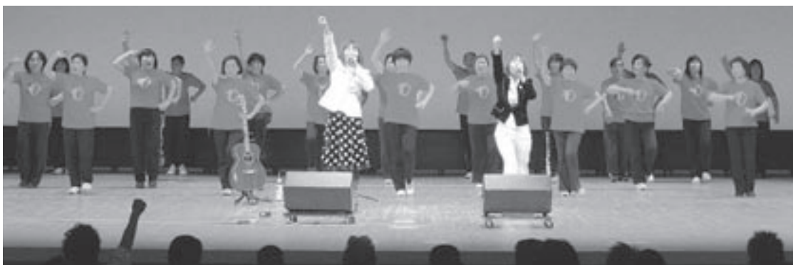
▲『Paix』とくらし元氣体操普及員の皆さん

倉吉市と琴浦町出身の女性デュオ『Paix(ペペ)』による公演では、代表曲『元氣出せよ』に合わせてくらし元氣体操が披露されるなど、会場が盛り上がりました。また、249回にも及ぶ更正施設でのライブを行っている『Paix』は、「自分の日常生活の足元に幸せがたくさんあって、その足元にある幸せをたくさん感じて生きていくことが一番の幸せ。これからも元氣に頑張ってください」と、新成人へメッセージを送りました。