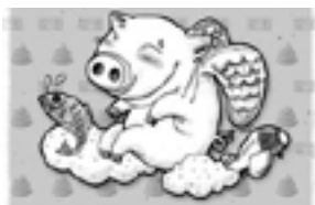
▲韓国で一番縁起のいい夢は「豚の夢」