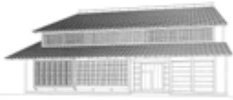
旧牧田家住宅主屋復元図

また、旧牧田家の保存修理で実際行っている土壁の小舞組みや壁塗り、柱の継手の組み立てなど伝統技術の修身体験を計画しています。この機会に伝統工法による修理に参加してみませんか。