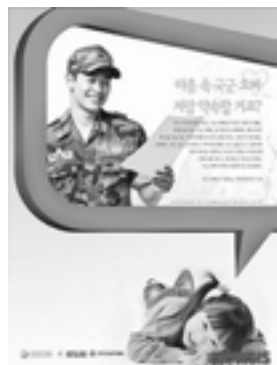
▲感謝の気持ちを込めて…

今月のキーワード 「国軍のおじさん!ありがとうございます」 국군 아저씨 감사합니다.