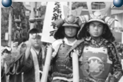
色鮮やかな衣装もりりしい武者たち。

今年の6月にお清め式を終えた道具・衣装を使用した御幸行列。道具・衣装がそろった行列は、壮観でした。