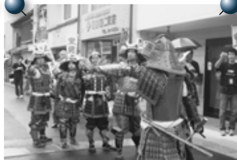
見よ、里見八賢士の勇姿！！

今年で3回目の里見時代行列。手作り甲冑 かっちゅう を身にまとい、白壁土蔵群周辺や関金温泉街・山守小学校周辺を勇ましい姿で練り歩きました。