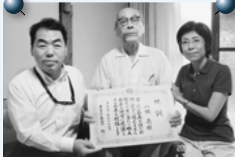
いつまでも元気で長生きしてください。

敬老の日に、今年度100歳以上の在宅高齢者7人(希望者)を対象に市長の表敬訪問が行われました。