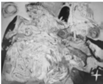
「生きるものたち「誕生」」 松原 政裕さん 作 市民応接室(4階)