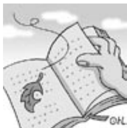
▲落ち葉と本の季節がやってきました。

(翻訳：木村言語研究所HP参考) いかがでしょうか、全文の紹介はできませんでしたが、秋の匂いを感じられましたか。 しかし、いくらわれわれの文学的感受性を高めてくれる落ち葉だとはいえ、火の用心を忘れてはいけませんね！