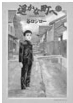
◎谷口ジロー『遙かな町へ』小学館